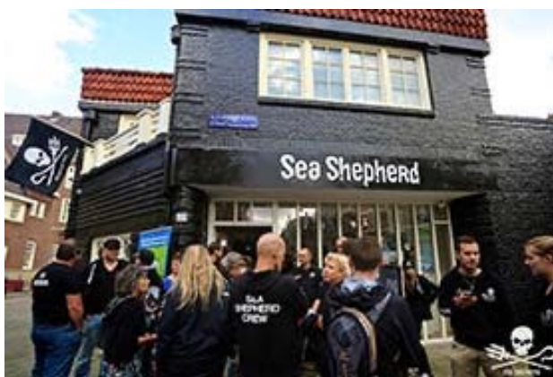
Het Sea Shepherd pand in de Amsterdam.

Met de verkoop van Sea Shepherd artikelen is in 2021 niets verdiend. Vanwege Covid-19 werden nagenoeg alle grote evenementen afgelast. Voor 2022 verwachten wij hier echter weer inkomsten; inmiddels heeft het eerste evenement in 2022, de Duikvaker, al plaatsgevonden.